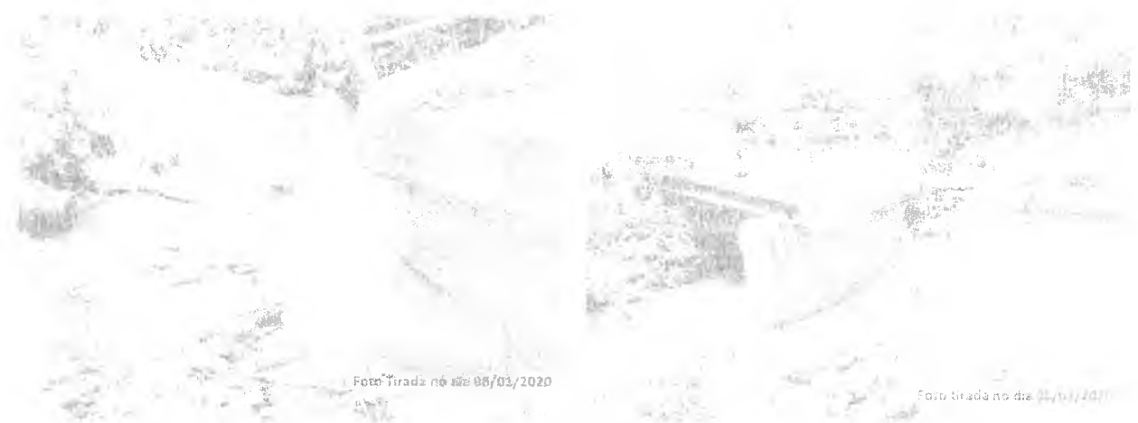
Fotos: Ponte Canal do Boi -- Ponte em ruínas, base de sustentação cedeu completamente

Valor Estimado para restabelecimento: (R$525.666,12).